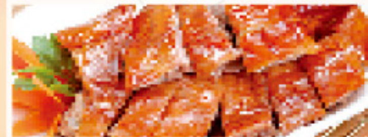
Met nasi of bami i.p.v. witte rijst € 1,30 extra Met mihoen i.p.v. witte rijst € 3,40 extra