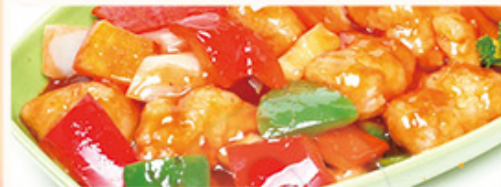
Met nasi of bami i.p.v. witte rijst € 1,30 extra Met mihoen i.p.v. witte rijst € 3,40 extra