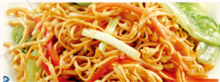
Met nasi of bami i.p.v. witte rijst € 1,30 extra Met mihoen i.p.v. witte rijst € 3,40 extra