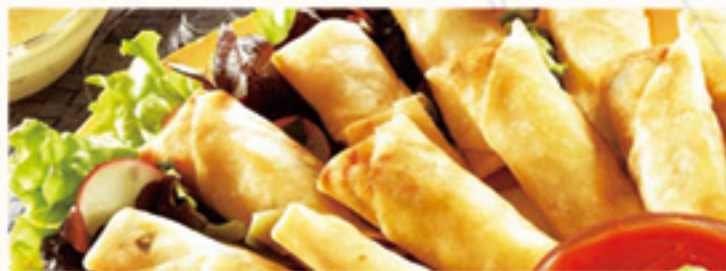
Met nasi of bami i.p.v. witte rijst € 1,30 extra Met mihoen i.p.v. witte rijst € 3,40 extra