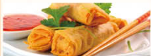
Met nasi of bami i.p.v. witte rijst € 1,80 extra Met mihoen of chau mie i.p.v. witte rijst € 4,80 extra