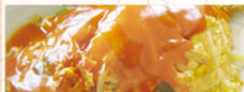
Met nasi of bami i.p.v. witte rijst € 1,80 extra Met mihoen of chau mie i.p.v. witte rijst € 4,80 extra