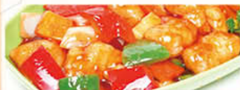
Met nasi of bami i.p.v. witte rijst € 1,80 extra Met mihoen of chau mie i.p.v. witte rijst € 4,80 extra