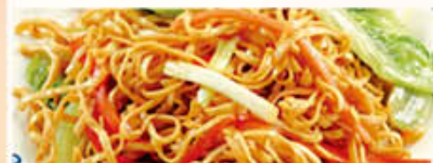
Met nasi of bami i.p.v. witte rijst € 1,80 extra Met mihoen of chau mie i.p.v. witte rijst € 4,80 extra