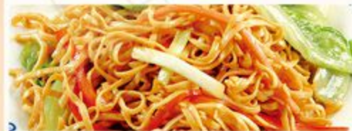
Met nasi of bami i.p.v. witte rijst € 1,80 extra Met mihoen of chou mie i.p.v. witte rijst € 4,80 extra