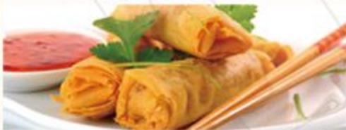
Met nasi of bami i.p.v. witte rijst € 1,80 extra Met mihoen of chou mie i.p.v. witte rijst € 4,80 extra