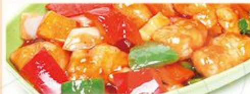
Met nasi of bami i.p.v. witte rijst € 1,80 extra Met mihoen of chou mie i.p.v. witte rijst € 4,80 extra