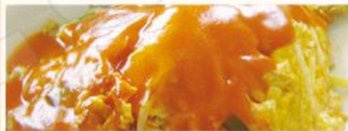
Met nasi of bami i.p.v. witte rijst € 1,80 extra Met mihoen of chou mie i.p.v. witte rijst € 4,80 extra